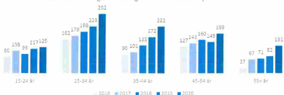
Aldersfordeling for færdigvisiterede fordelt på år 2020

2021-mi illoqarfinni tamani, Qaanaaq Ittoqqoortoormiillu kisiisa pinnagit, najukkani katsorsaasamerit amerlanerit piviusunngortinnerisigut naatsorsuutaavoq suli amerlanerusut katsorsarneqartalerumaartut. Ulloq 25. maaji aallarnerfigalugu innuttaasut 495-it katsorsartinnissamat innersuunneqarsimapput.